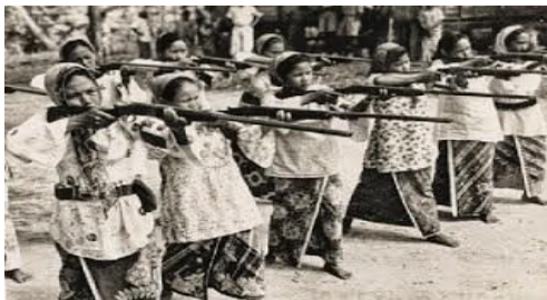
Pasukan Home Guard wanita

12. Gambar berikut merujuk kepada pasukan keselamatan yang ditubuhkan oleh British.